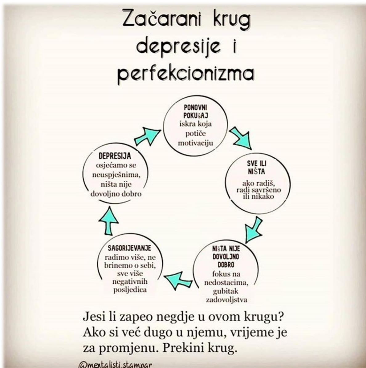
Slika 1: Začarani krug depresije i perfekcionizma

izbjegavaju i ne dopuštaju drugima da vide njihove pogreške, ne shvaćajući da će tek autentičnost, otkrivena introspekcijom i/ili tijekom terapijskog procesa, omogućiti uspostavljanje smislenijih, istinskih odnosa. Zbog ovog začaranog kruga misli i ponašanja u međuljudskim odnosima, perfekcionista često imaju poteškoće biti bliski ljudima i zbog toga imaju manje nego zadovoljavajuće međuljudske odnose. Svi ovi simptomi mogu voditi do poteškoća s raspoloženjem, poput depresivnosti (vidi sliku 1)